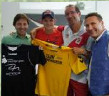
Auftaktspiel Team Morgenstern, Toni und Friends, Austrostar und Falkensteiner