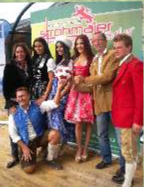
"Tracht meets Europacup" mit Miss Austria 2012, 2011...!