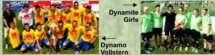
→ Dynamite Girls